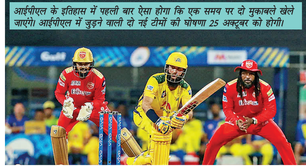
आईपीएल के इतिहास में पहली बार ऐसा होगा कि एक समय पर दो मुकाबले खेले जाएंगे। आईपीएल में जुड़ने वाली दो नई टीमों की घोषणा 25 अक्टूबर को होगी।

मुंबई. इंडियन प्रीमियर लीग 2021 अब आखिरी पड़ाव की तरफ रुख कर चुका है। लेकिन इस सीजन बचे कुछ मैचों के पहले इसके शेड्यूल में एक बड़ा बदलाव किया गया है। बता दें कि आईपीएल के लीग चरण के आखिरी दो मैच एक ही समय पर शाम साढ़े सात बजे (भारतीय समयानुसार) शुरू होंगे। ऐसा आईपीएल के इतिहास में पहली बार हो रहा है जब दो मैच एक ही समय पर खेले जाएंगे। आईपीएल संचालन समिति ने इस बारे में जानकारी दी। बीसीसीआई की तरफ से जारी बयान के मुताबिक, 'आईपीएल के लिए पहली बार दो मुकाबले एक ही समय में होंगे। अंतिम दो मैचों में से एक में सनराइजर्स हैदराबाद का सामना मुंबई इंडियन्स और दूसरे में रॉयल चैलेंजर्स बंगलोर का मुकाबला दिल्ली कैपिटल्स से है। 8 अक्टूबर को पहले मैच में सनराइजर्स हैदराबाद का सामना मुंबई इंडियन्स (55वां मैच) और दूसरे मैच में रॉयल चैलेंजर्स बंगलोर का सामना दिल्ली कैपिटल्स (56वां मैच) से होना है। अब यह दोनों मैच एक ही समय पर होंगे। बीसीसीआई ने हालांकि, इसके पीछे की वजह के बारे में नहीं बताया है। बता दें कि आम तौर पर डबल हेडर (एक दिन में दो मैच) का एक मुकाबला दोपहर बाद और