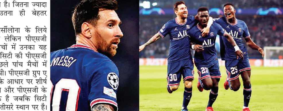
तालमेल बन रहा है। जितना ज्यादा साथ खेलेंगे, उतना ही बेहतर प्रदर्शन होगा।' मेस्सी ने बार्सिलोना के लिये 672 गोल किये लेकिन पीएसजी के लिये तीन मैचों में उनका यह पहला गोल था। सिटी को पीएसजी के खिलाफ पिछले पांच मैचों में यह पहली बार थी। पीएसजी ग्रुप ए में गोल औसत के आधार पर शीर्ष पर है। क्लब ब्रजे और पीएसजी के समान चर अंक है जबकि सिटी तीन अंक लेकर तीसरे स्थान पर है।

पेरिस. लियोनेल मेस्सी ने पेरिस सेंट जर्मेन के लिये पहला गोल दागा जिसकी बदौलत टीम ने चैम्पियंस लीग ग्रुप चरण में मैनचेस्टर सिटी को 2-0 से हराया। छह बार के फीफा के सर्वश्रेष्ठ खिलाड़ी मेस्सी ने 74वें मिनट में गोल दागा जिसके लिये उन्हें पित्तक काइलियान एम्बाप्पे से मिली थी। जीत के बाद मेस्सी ने कहा, 'मैं मुझे खुशी है कि गोल कर सका। मैंने हाल ही में ज्यादा नहीं खेला है और यही टीम के साथ धीरे धीरे