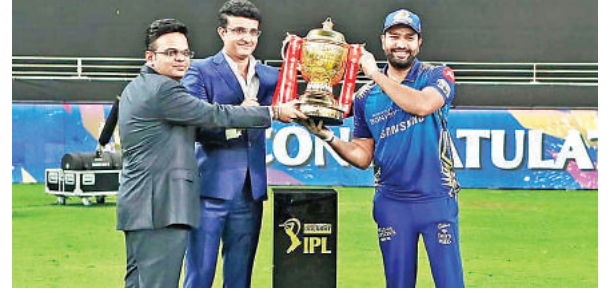
अभी स्टार इंडिया के पास आईपीएल के राइट्स हैं। उसने 2017 में 2022 तक के मीडिया राइट्स 16 हजार करोड़ रुपये से भी ज्यादा रकम खर्च कर हासिल किए थे।

मुंबई. बीसीसीआई ने आईपीएल 2021 के बीच में ही इस टूर्नामेंट के मीडिया राइट्स बचने के लिए टेंडर जारी करने का ऐलान किया है। भारतीय बोर्ड ने कहा कि 25 अक्टूबर को वह 2023 से 2027 के आईपीएल के लिए मीडिया राइट्स के लिए टेंडर निकालेगा। इस फैसले ने हलचल पैदा कर दी है। आईपीएल के मीडिया राइट्स हासिल करने के लिए देश-विदेश की कंपनियों में काफी दिलचस्पी होती है। अभी स्टार इंडिया के पास आईपीएल के राइट्स हैं। उसने 2017 में 2022 तक के मीडिया राइट्स 16 हजार करोड़ रुपये से भी ज्यादा रकम खर्च कर हासिल किया था। यह मीडिया राइट्स का ही दबाव था कि बीसीसीआई ने कोरोना काल में ही आईपीएल कैंसिल नहीं किया। अब नए सिर से मीडिया राइट्स के लिए ब्रांडकास्टर्स के बीच टक्कर होगी। स्टार इंडिया के साथ ही सोनी-जी, अमेजन जैसी कंपनियां आईपीएल राइट्स की रेस में रहेंगी। इनके साथ ही रिलायंस भी दावेदारी पेश कर सकता है।