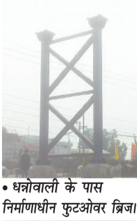
• धनोवाली के पास निर्माणाधीन फुटओवर ब्रिज।