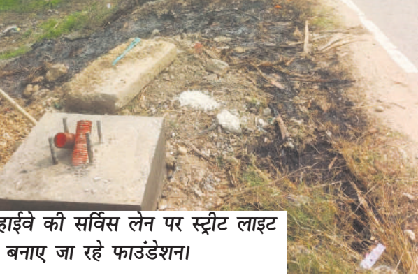
• नेशनल हाईवे की सर्विस लेन पर स्ट्रीट लाइट लगाने हेतु बनाए जा रहे फाउंडेशन।