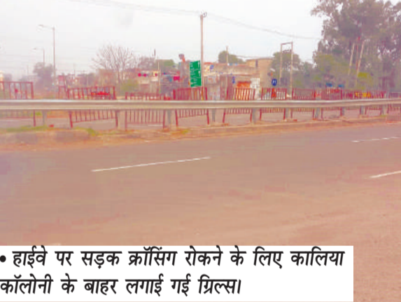
• हाईवे पर सड़क क्रांसिंग रोकने के लिए कालिया कॉलोनी के बाहर लगाई गई ग्रिल्स।