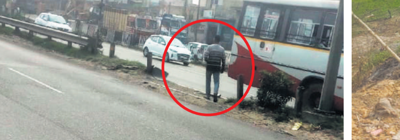
• क्रांसिंग के लिए अवैध रूप से लोगों द्वारा तोड़े गए मेटल बीम क्रैश बैरियर (एमबीसीबी) से निकलता एक युवक।