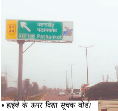
• हाईवे के ऊपर दिशा सूचक बोर्ड।