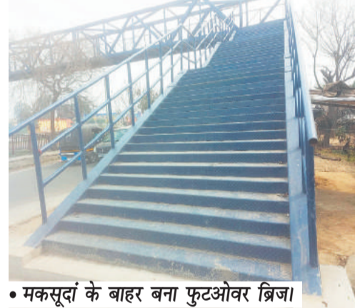
• मकसूदां के बाहर बना फुटओवर ब्रिज।