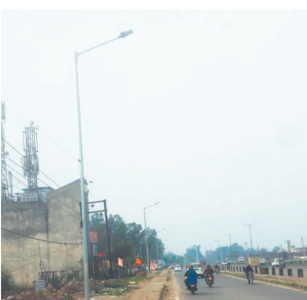
• एलपीयू से जालंधर विधीपुर तक सर्विस लेन में लगी स्ट्रीट लाइट्स।