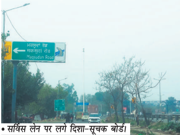
• सर्विस लेन पर लगे दिशा-सूचक बोर्ड।