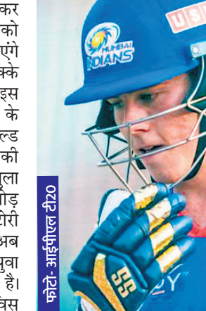
मुंबई के युवा खिलाड़ी ब्रेविस ने लगाया सबसे लंबा छक्का

पंजाब किंग्स के विस्फोटक बल्लेबाज लियाम लिविंगस्टोन इस सीजन में खूब तहलका मचा रहे हैं। इस सीजन में वे सबसे ज्यादा लंबे छक्के लगाने वाले बल्लेबाज हैं। लिविंगस्टोन ने चेन्नई के खिलाफ