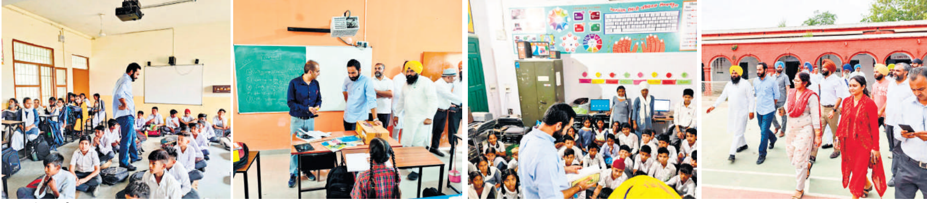
• जालंधर ब्रीज. गढ़शंकर/चंडीगढ़

मीत हेअर बोले- शिक्षा सुधारों के लिए ज़मीनी हकीकतें जानने के लिए ली जा रही है फीडबैक