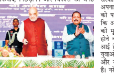
अलग-अलग कर राजनीतिक को बचाव देने का काम किया, उन्हें पश्चानाति की आवश्यकता है।

रुपयों का नहीं होता था लेकिन आज एक महीने में करोड़ों रूपयों के विकास कार्य पूरे हो रहे हैं और ये अंतर जम्मू-कश्मीर में शांति प्रस्थापित होने से आया है। अमित शाह ने कहा कि आज जम्मू-कश्मीर में लोगों के घरों में 24 घंटे बिजली आपूर्ति होती है और ये बहुत बड़ा परिवर्तन है। उन्होंने कहा कि जब नवाना परिवर्तन का स्वागत करती है तभी लोकतंत्र मान्य होता है। उन्होंने कहा कि निम्न तीन परिवारों ने जम्मू-कश्मीर में आतंकवाद, पिछड़ापन और विकास को जहा