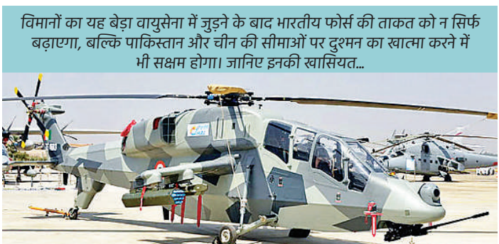
विमानों का यह बैच वायुसेना में जुड़ने के बाद भारतीय फोर्स की ताकत को न सिर्फ बढ़ाएगा, बल्कि पाकिस्तान और चीन की सीमाओं पर दुश्मन का खतरा करने में भी सक्षम होगा। जानिए इनकी खासियत...

बॉर्डर पर दुश्मन का खतरा वायुसेना के अधिकारियों ने कहा है कि 5.8 टन वजन की एलसीएच 'एडवांस लाइट हेलिकॉप्टर' ध्रुव से समानता रखता है। इन्हें कई में 'स्ट्रैटल्यू' (राइडर से बचने की) विशेषता, बख़्तरबंद सुरक्षा प्रणाली, रात को हमला करने और