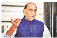
जालंधर ब्रीज, नई दिल्ली

भारतीय वायुसेना के बेड़े में आज देश का पहला स्वदेशी विमान जुड़ गया है। 10 लाइट कॉम्बैट हेलिकॉप्टर्स का पहले बैच वायुसेना में शामिल हो गया है। विमानों का यह बैच भारतीय फोर्स की ताकत को न सिर्फ बढ़ाएगा, बल्कि पाकिस्तान और चीन को सीमाओं पर दुश्मन का खतरा करने में भी सक्षम होगा।