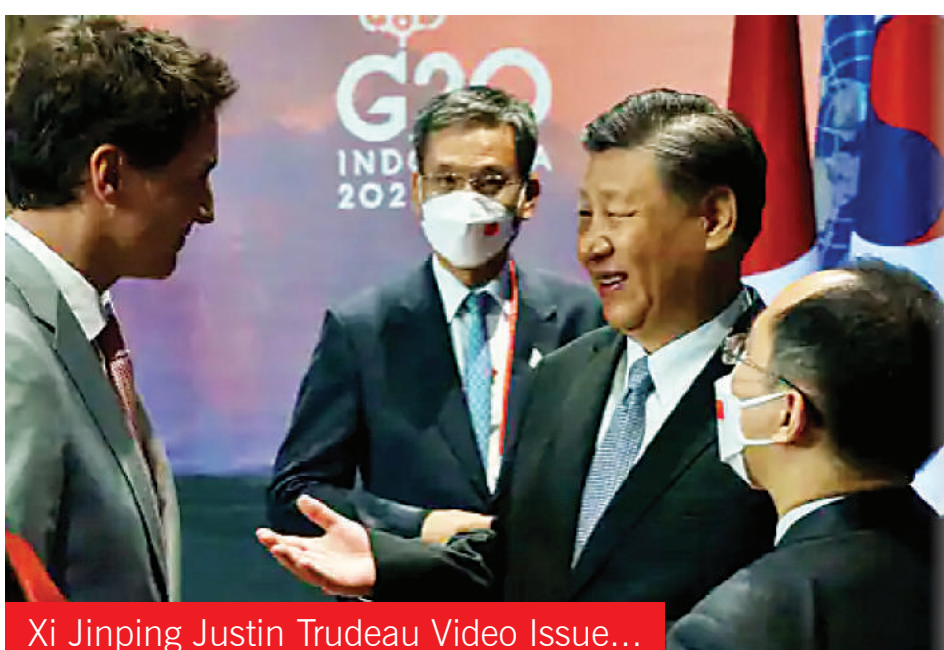
Xi Jinping Justin Trudeau Video Issue...

जिसका अनुवाद अंग्रेजी में करके उनके आधिकारिक ट्रांसलेटर ने इसे टूडो से कहा। कनाडा के पीएम टूडो ने भी दिया जवाब टूडो भी नहीं रुके और उन्होंने अनुवादक को बीच में टोकते हुए कहा, "हम स्वतंत्र, खुले और स्पष्ट संवाद में विश्वास करते हैं और यही हम करते रहेंगे। हम रचनात्मक रूप से एक साथ काम करना जारी रखेंगे लेकिन ऐसी चीजें होंगी जिन पर हम असहमत होंगे।" इस पर चीनी राष्ट्रपति जिनपिंग ने कहा, "पहले हम स्थितियाँ बनाएँ", जिसके बाद दोनों ने हाथ मिलाया और अलग-अलग दिशा में चले गए। जिनपिंग के साथ बातचीत के बारे में पूछे जाने पर, टूडो ने कहा, "हर बातचीत आसान नहीं होने वाली है, लेकिन यह अत्यंत महत्वपूर्ण है कि हम उन चीजों के लिए खड़े हों जो कनाडाई लोगों के लिए अहम हैं।"