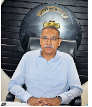
कहा जिला शिक्षा अधिकारी (सेकेंडरी व एलिमेंट्री) को निर्देश देते हुए कहा कि जिन स्कूलों में पोलिंग स्टेशन बने हैं, उन स्कूलों के प्रिंसिपलों व स्कूल प्रमुख को हिदायत की जाए कि उक्त तिथियों को स्कूल के चौकिंदार या किसी जिम्मेदार कर्मचारी की ड्यूटी लगाकर पोलिंग बूथ वाला कमरा व मैन गेट खुला रखा जाए। इसके अलावा संबंधित बी.एल.ओज को जरूरी फर्नीचर मुहैया करवाया जाए।