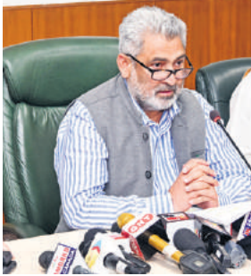
न्यूनतम समर्थन मूल्य 2060 रुपए प्रति क्विंटल के हिसाब से की जा चुकी है और बाकी की खरीद भी आज शाम तक मुकम्मल हो जायेगी। गुरुवार को यहां अनाज भवन में धान के खरीद सीजन सम्बन्धी पत्रकारों के रू-ब-रू होते हुये पंजाब के खाद्य, सिविल सप्लाइ और उपभोक्ता मामले

मुख्यमंत्री भगवंत मान के नेतृत्व वाली पंजाब सरकार ने मौजूदा धान के सीजन की शुरुआत से पहले सभी सम्बन्धित पक्षों किसान, मजदूर, मिल्लर और आढ़तियों के साथ वायदा किया था कि उनको इस सीजन के दौरान कोई भी समस्या पेश नहीं आने दी जायेगी। सरकार अपने इस वायदे पर पूरी तरह खरी उतरी है जिसका प्रमाण इसी बात से मिलता है कि सरकारी की तरफ से मौजूदा सीजन के दौरान राज्य भर की मंडियों में किये पुझा प्रबंधों के कारण 184 लाख मीट्रिक टन धान के लक्ष्य में से अब तक 180 लाख मीट्रिक टन की खरीद भारत सरकार द्वारा निर्धारित किये