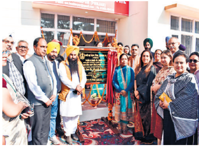
उन्होंने राम कालोनी कैंप स्थित ओल्ड एज होम, चिल्ड्रन होम, स्पेशल होम का भी दौरा कर वहां बुजुर्गों व बच्चों से मुलाकात कर उनकी जरूरतों को पहल के आधार पर पूरा करने का भरपूर प्रयास किया।