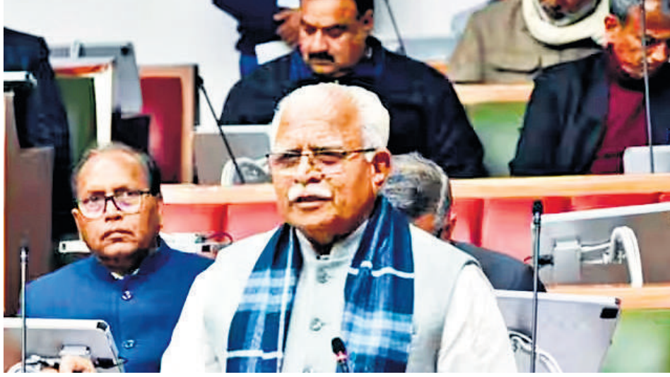
कुरुक्षेत्र और रेवाड़ी का जन्म के समय लिंगानुपात 2016-17 में दर्ज किए आंकड़ों से भी नीचे चले

हरियाणा में साल 2022 के लिंगानुपात के चौंकाने वाले आंकड़े सामने आए हैं। जहां जन्म के समय लिंगानुपात 900 से भी नीचे चला गया है। आंकड़ों के मद्देनजर स्वास्थ्य मंत्री अनिल विज ने जांच के आदेश दिए हैं।