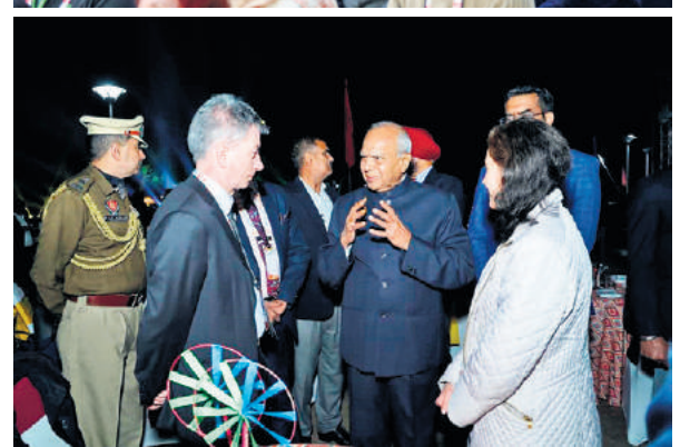
जी20 प्रेसीडेंसी के तहत इंटरनेशनल फाइनेंशियल आर्किटेक्चर वर्किंग ग्रुप की पहली बैठक चंडीगढ़ में हुई। इस दौरान देश-विदेश से एकत्रित लोगों ने भारतीय कल्चरल प्रोग्राम का आनंद लिया।