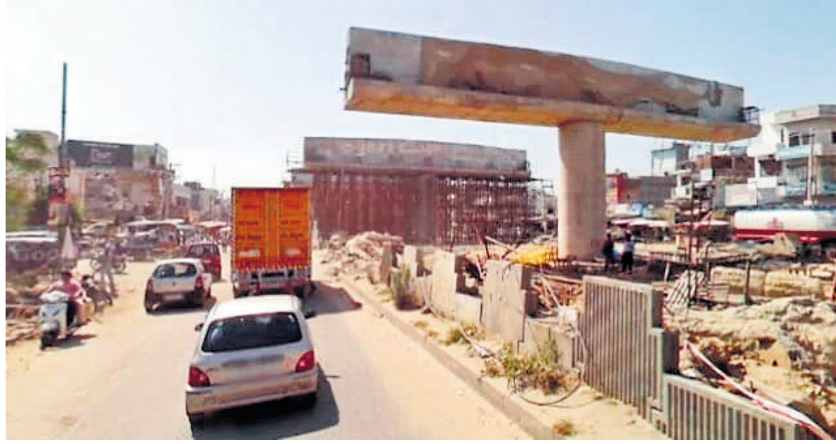
लंबे समय से निर्माण अधीन पड़ा जालंधर-अमृतसर हाईवे।