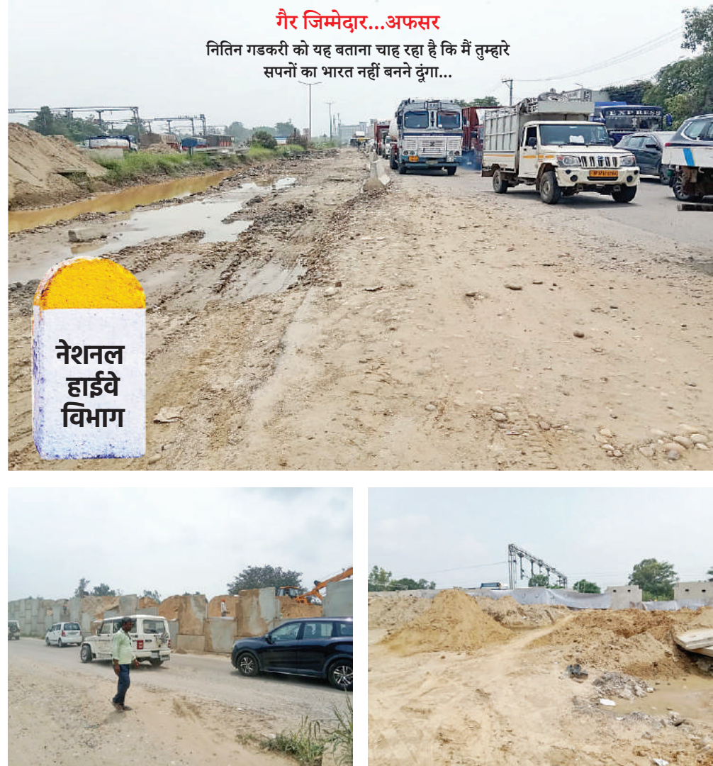
गैर जिम्मेदार...अफसर नितिन गडकरी को यह बताना चाह रहा है कि मैं तुम्हारे सपनों का भारत नहीं बनने दूंगा...