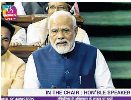
IN THE CHAIR : HON'BLE SPEAKER