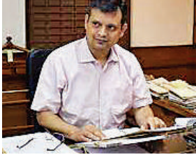
• जालंधर ब्रीज. चंडीगढ़