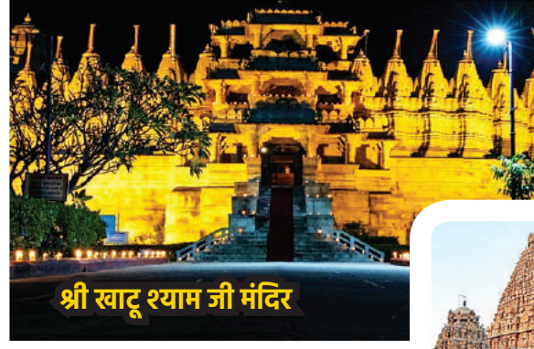
श्री खाटू श्याम जी मंदिर

बल्केश्वर महादेव मंदिर महादेव शिव को समर्पित है, और ये 700 साल से ज्यादा पुराना है। कहा जाता है कि एक गाय इस क्षेत्र में नदी के पास घूम रही थी और एक स्थान पर वह जोर-जोर से रंभाने लगी, जिसने आसपास के सभी ग्रामीणों का ध्यान आकर्षित किया। उसी जगह पर एक शिव लिंग पाया गया और लोगों द्वारा यहां एक शिव मंदिर का निर्माण किया गया।